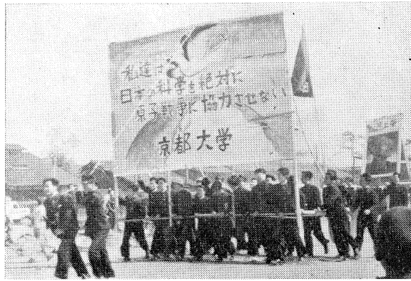
昭和二十九年のメーデー風景

外の人びとに深い感銘を與えた。結局この事件は十二名譴責という軽い處分で終止符を打つたが、それは「問題が破防法であり學生の眞劍な悩みから出た行動であることを了解、諸般の狀勢を考えて」決定されたものであつた。