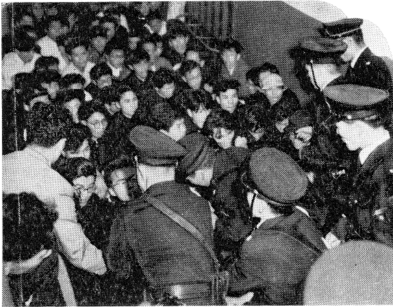
警官によつて總長室前から退場させられる學生

二十九年の十一月には秋季文化祭が開催されたが、そのとき學生代表は大學の再三の警告および禁止を無視して、二回にわたり學外者を交えて不許可の屋外集會を強行した。大學はこれに對して告示をもつて同學會に猛省を促したが、越えて三十年六月の創立記念祭のときには特に自重を要望したたびの助言指導を行なつた。しかし同