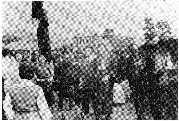
昭和三十一年園遊會風景

を得ず大學は警官隊の出勤を請い、警察の力でようやく総長は行動の自由を恢復したのである。當然同學會には解散命令が下り、記念祭およびその行事は禁止され、責任者は一名無期停學、七名六か月停學の處分をうけた。無期停學者は文學部の學生であり、暴行事件の責任を問われたものであるが、暴力行爲の容疑で、問題は現在は司直の手に委ねられている。この事件は學内問題から起つた點で従來の諸事件と性質を多少異にするが、總長が自己の大學内を自由に歩き得なくされたという點で、世論は學生に對して極めて冷やかなものがある。