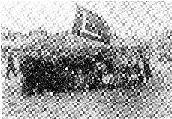
昭和三十一年園遊會に集まつた文學部教官と學生

三十一年の五月二十五、六日は創立記念祭が行われたが、日は創立記念祭が行われたが、内野教授をはじめ約二千人の學生が集つた。餘興に六齋念佛踊や謠曲があり、ビールのジョッキを片手にした教官・學生の交歓が至るところに見られて和氣霽靄とした雰囲気のみなごり會は盛況を極めた。しかし學者の入场は許可せられず、守衛の検査によつて、家族・ガールフレン