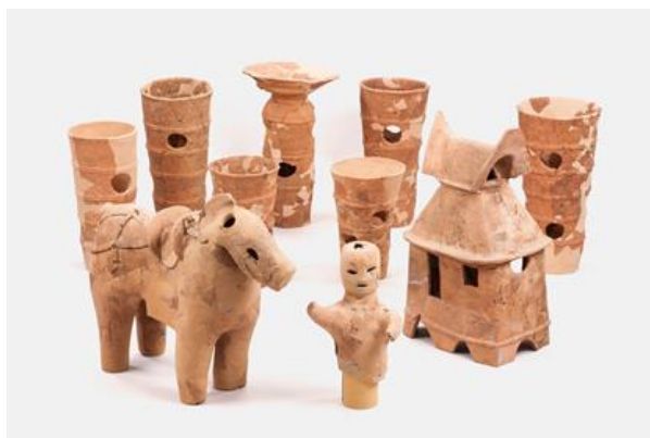
吉田南構内で出土した埴輪