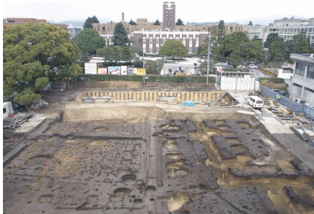
吉田南構内の発掘風景

京大構内遺跡の発掘調査とその整理・検討を進め、その成果を京大独自の文化遺産として多角的に活用・発信することを目指します。