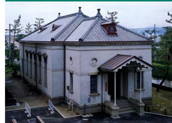
尊攘堂(京大構内遺跡出土遺物展示施設)

CENTER FOR STUDIES OF CULTURAL HERITAGE AND INTER HUMANITIES